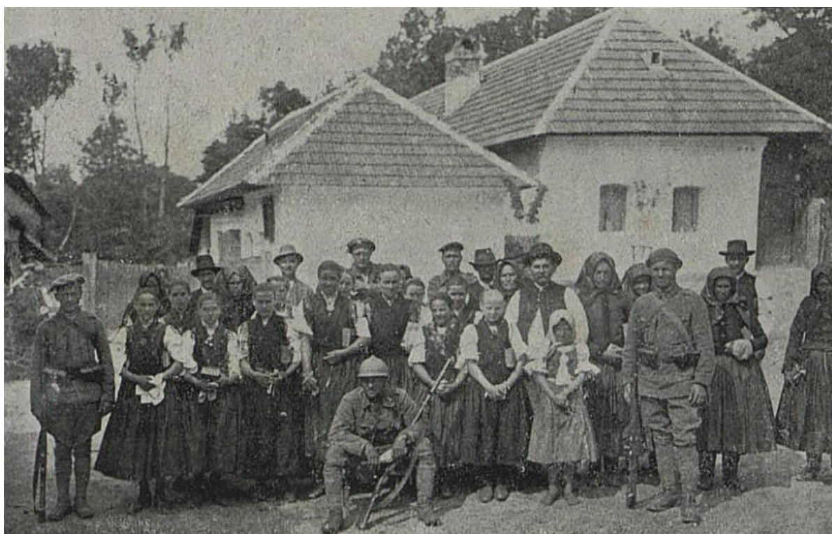
Fotografia, zachytávajúca československých vojakov s dedinčanmi pri Vrábľoch